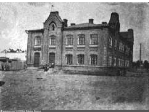
Семипалатинская школа №1 имени Н.Г. Чернышевского