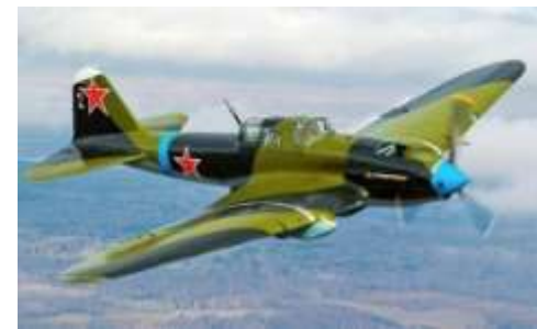
Штурмовик Ил - 2