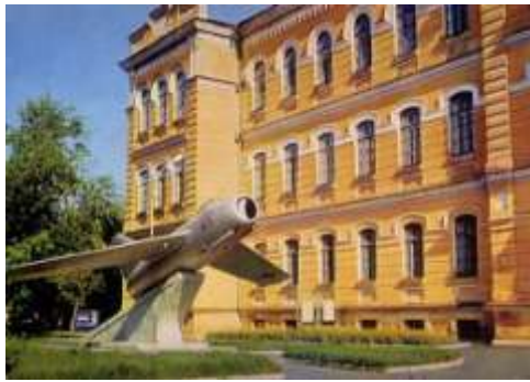
Чкаловское (Оренбургское) военно-авиационное училище