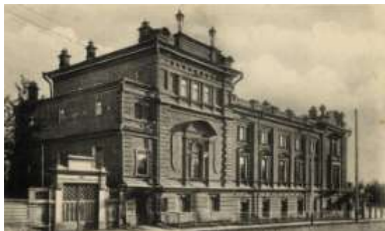
Свердловское музыкальное училище имени П.И. Чайковского