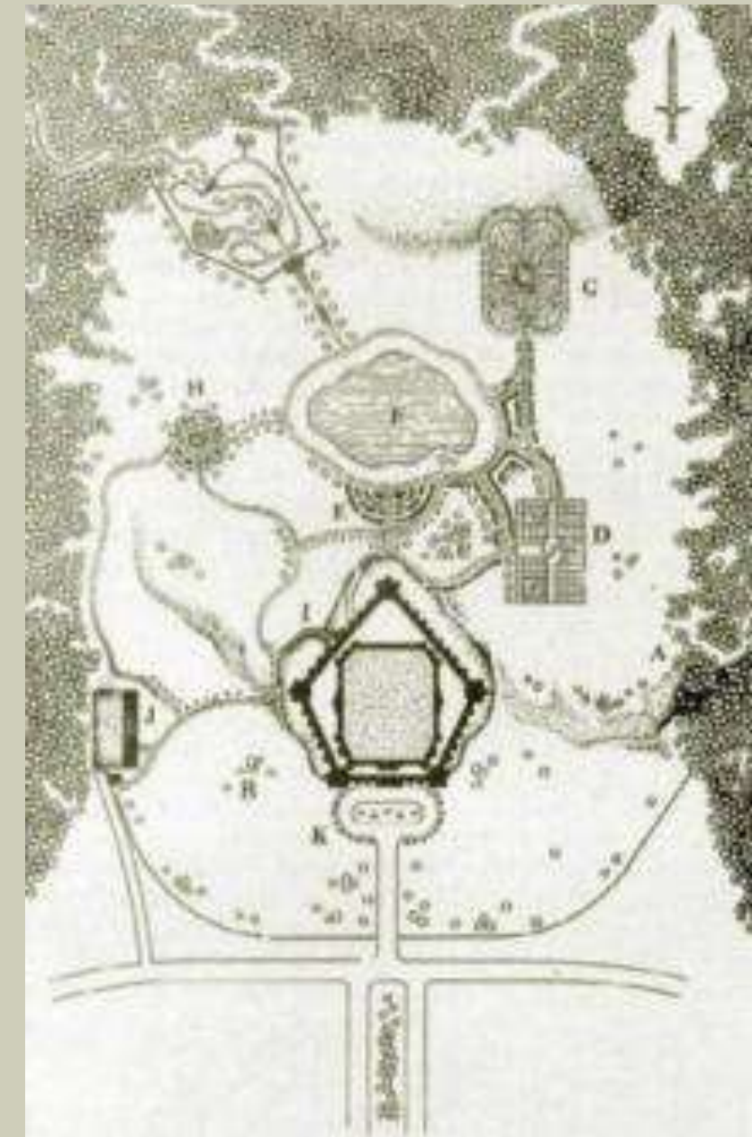
Карта замка Амбера

Роджер Джозеф Желязны – писатель, без чьего вклада невозможно представить современное фэнтези. Находясь у истоков Новой волны американской фантастики, он увёл жанр от привычных архетипов о сражении добра и зла. В его романах на смену классическим героям и злодеям пришли сложные, неоднозначные личности с кучей скелетов в шкафу.