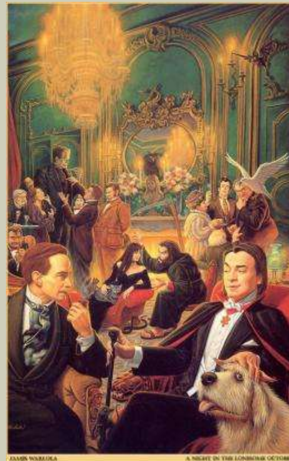
Иллюстрация к книге «Ночь в тоскливом октябре»