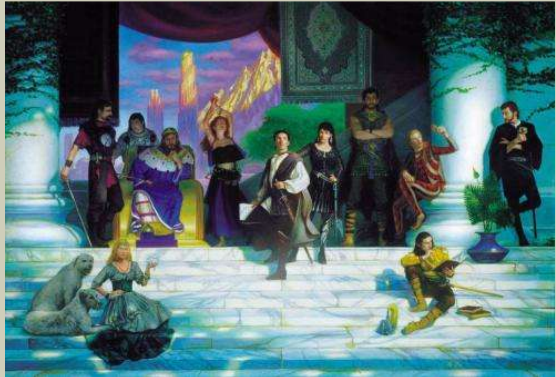
Иллюстрация Донато Джанкола

Ему не хватало классических мифов, поэтому в его произведениях мы встретим и древнюю мифологию, и поверья народов мира, и современные концепции гуманитарных наук.