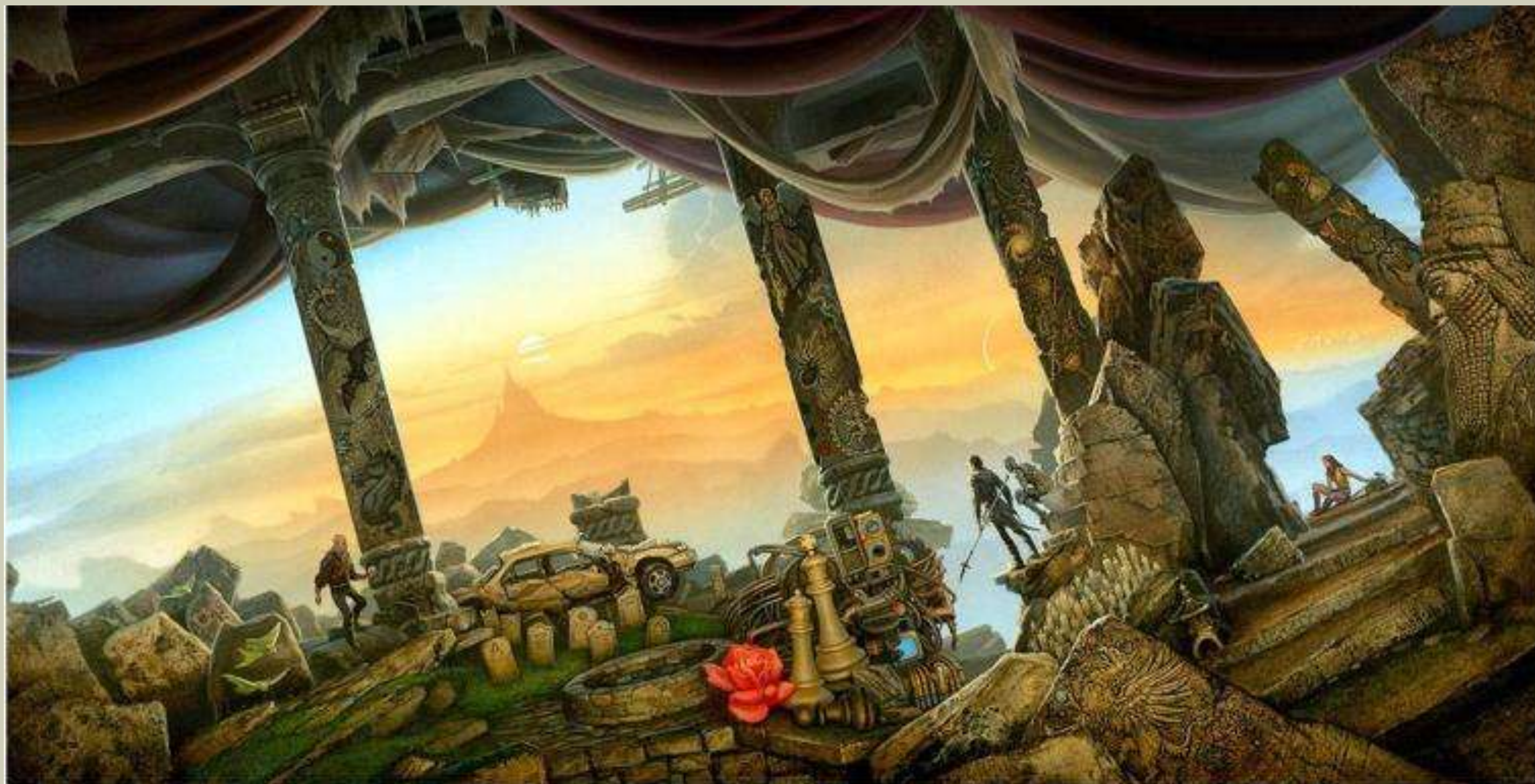
Иллюстрация Майкла Уэллана к произведению Роджера Желязны