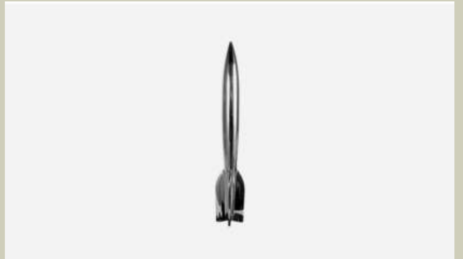
Премия «Хьюго». Статуэтка в форме ракеты

Библиография автора насчитывает несколько десятков рассказов и романов. Автор шесть раз получал премию «Хьюго», три раза «Небьюлу», один раз французскую «Аполло». Был удостоен премии журнала «Локус» за создание «Хроник Амбера».