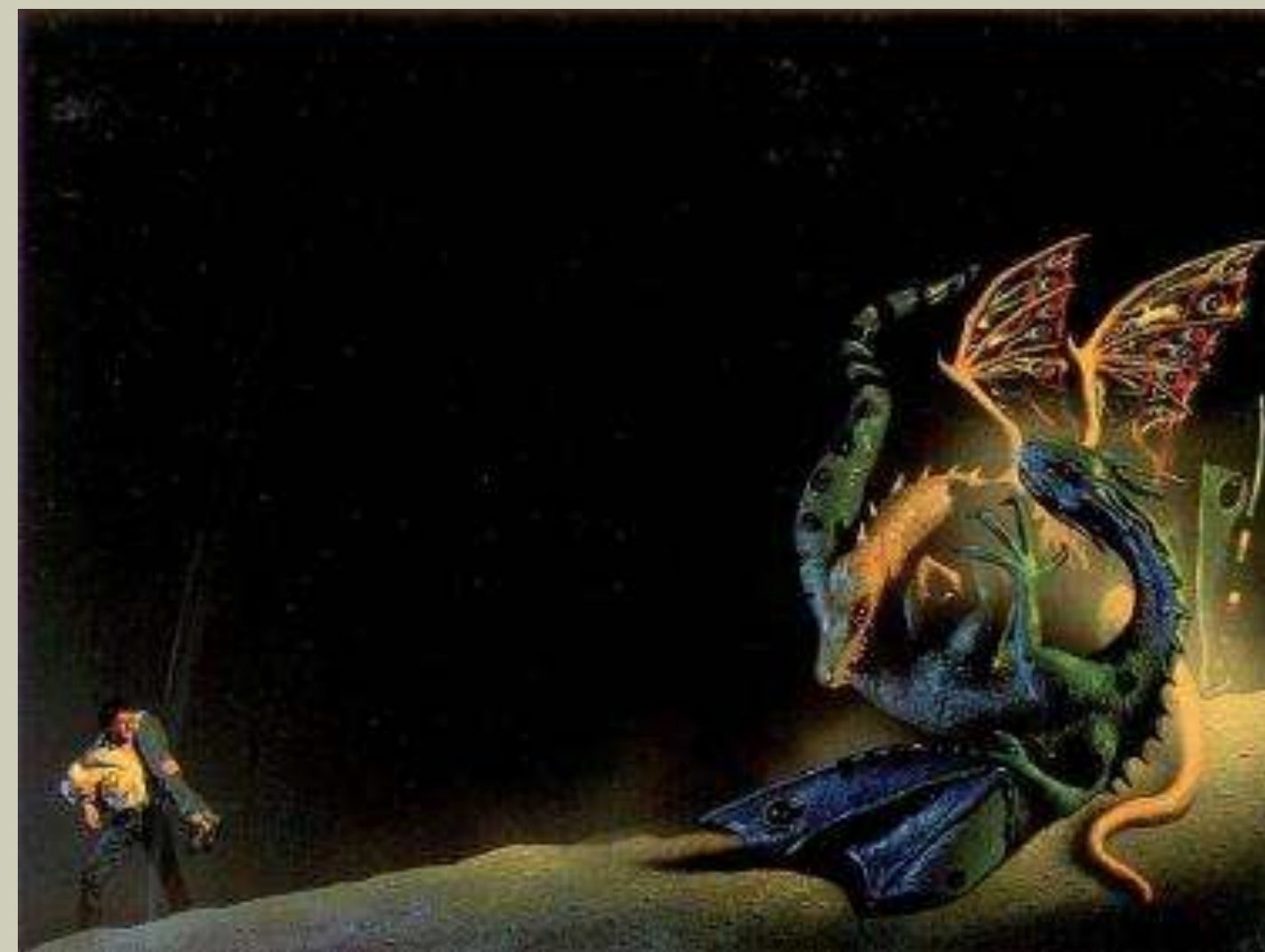
Вариант обложки от Тима Уайта к Знаку Хаоса

Его произведения значительно расширили представления о том, что такое «магия» и какие формы она может принимать, от забытых технологий прошлого до эзотерических способностей богов старых религий. Желязны любил совмещать древнюю историю и современность, обоснованную фантастику и чистую магию, сюрреалистические сны и злободневные проблемы.