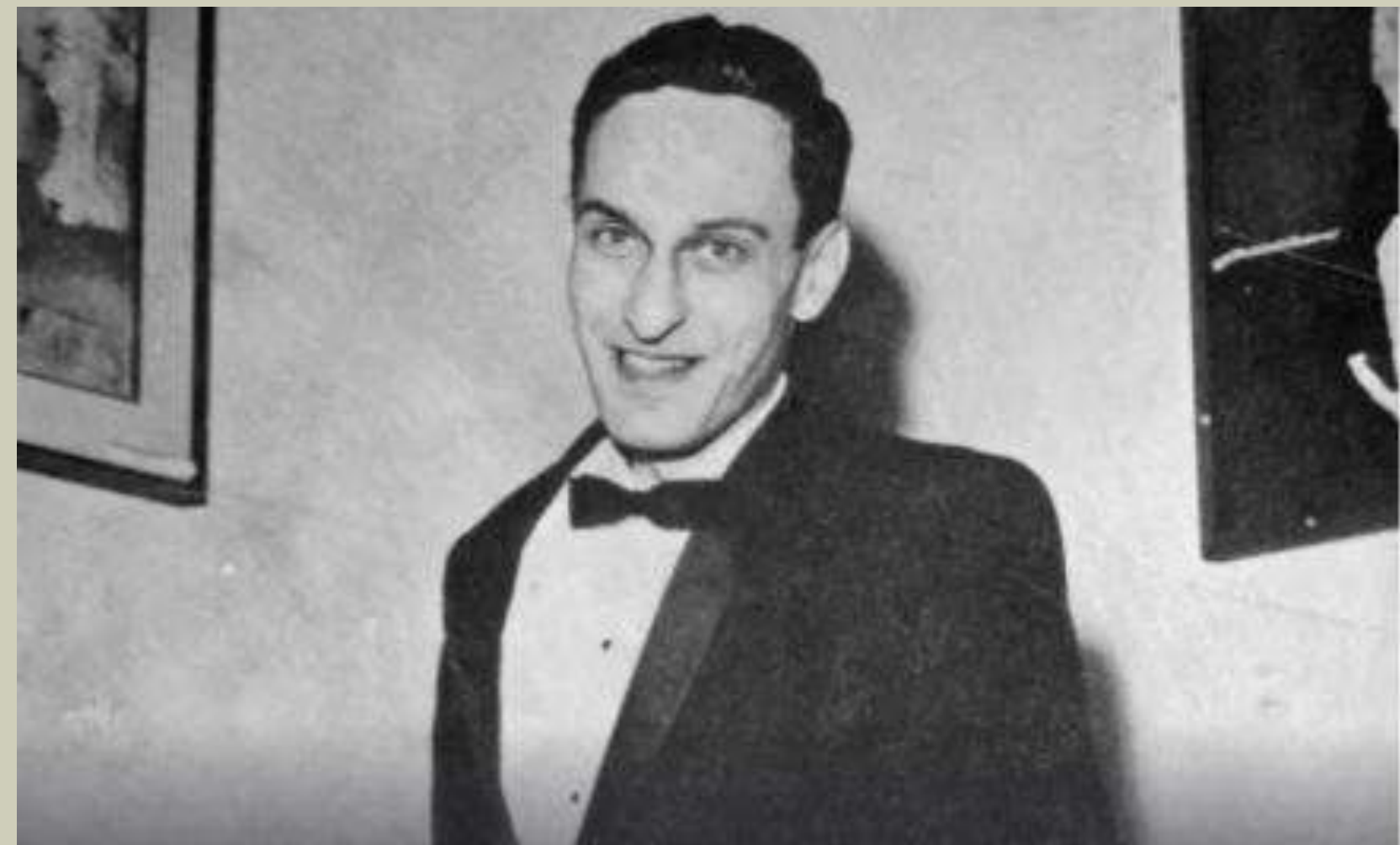
Роджер Желязны в молодости

С юности Роджер разносторонне развивался: занимался восточными единоборствами, играл в шахматы, изучал хинди и японский язык, увлекался мистикой и медитацией, писал стихи, а также начинал работать над фантастическими рассказами. Во второй половине 1960 года юноша отправился в армию. Он был солдатом Национальной гвардии, входил в состав боевого расчёта ракет «Ника», а также некоторое время был сотрудником подразделения психологической войны.