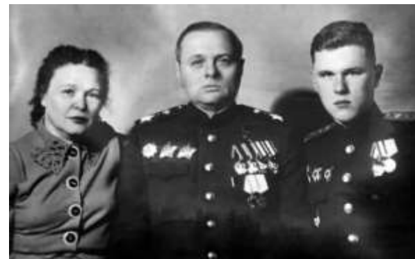
К.А. Мерецков с женой и сыном

После встречи с И.В. Сталиным генерал армии Мерецков в качестве представителя Ставки Верховного Главнокомандования вылетел для оказания помощи командованию 7-й армии Карельского фронта. Так для Кирилла Афанасьевича началась Великая Отечественная война, большую часть которой он провёл на северо-западном и северном участках советско-германского фронта.