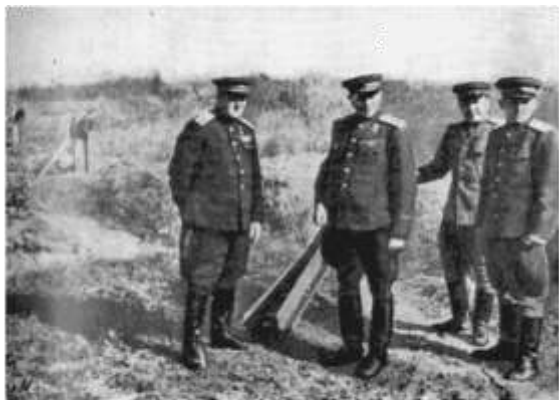
Командующий 1-м Дальневосточным фронтом К. А. Мерецков осматривает японские укрепления.

Великую Отечественную войну К.А. Мерецков закончил на территории Норвегии. В 1944 году получил звание Маршала Советского Союза и высшие награды Норвегии.