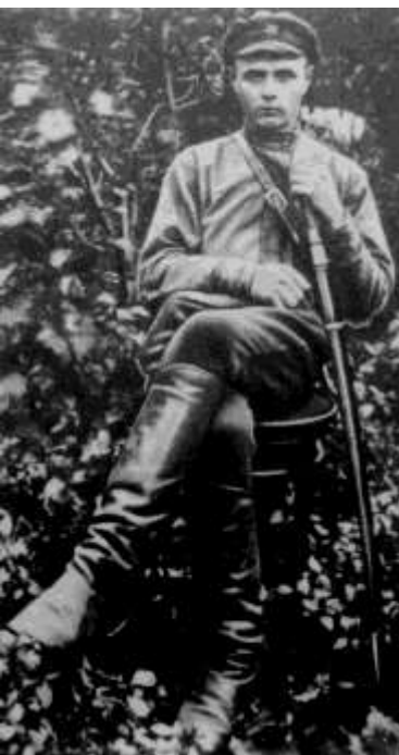
К.А. Мерецков 1918 год

В РККА с 1918 года. Участник Гражданской войны в России: был комиссаром отряда, помощником начальника штаба бригады и дивизии. Воевал на Восточном, Южном и Западном фронтах. Трижды был тяжело ранен.