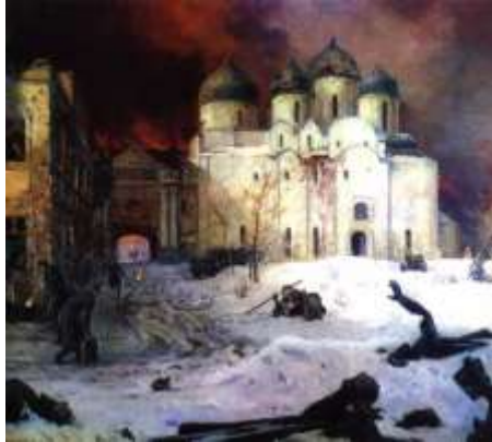
Кукрыниксы. Бегство фашистов из Новгорода

Репетировали гармоничное сочетание артиллерийского наступления с авиационным. Командующий фронтом регулярно проверял готовность частей и подразделений к наступлению, добиваясь, чтобы буквально каждый боец знал свой манёвр.