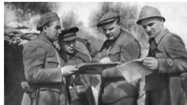
К.А. Мерецков в Испании

[Здесь и в этом качестве именно Кирилл Афанасьевич заложил фундамент всех будущих побед Красной Армии во всех проведенных ею впоследствии зимних операциях. Перво-наперво он «утеплил» вверенные ему войска: солдаты и офицеры получили шапки-ушанки вместо прославленных, но слабо согревавших «будёновок»; валенки вместо ботинок и сапог; полушубки и ватники, также ставшие впоследствии легендарными. Был организован подвоз на передовую горячей пищи и раздача «ста граммов», названных позже «наркомовскими»].