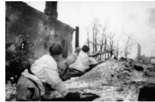
Бои в Луге

При подготовке Новгородско-Лужской наступательной операции 1944 года командующий войсками Волховского фронта предусмотрел целую систему мероприятий по оперативной маскировке для скрытия целей операции и введения противника в заблуждение. Вся подготовка к боевым действиям осуществлялась в строжайшей тайне, о замысле её долгое время не знало даже командование 59-й армии, которой отводилась решающая роль в операции. Одновременно с реальным был разработан ложный план операции, рассчитанный на дезинформацию противника. Все мероприятия по подготовке боевых действий проводились скрытно, без изменения боевого режима и группировок войск. Скрытность, считал К.А. Мерецков, приводит к внезапности и успеху в самом начале операции, что имеет чрезвычайно важное значение.