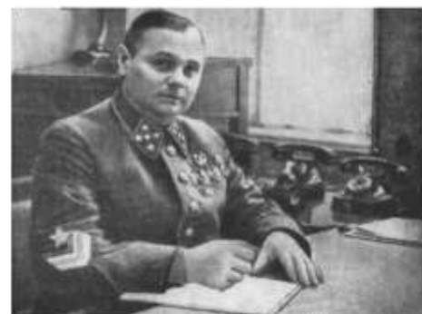
К.А.Мерецков — начальник Генерального штаба

При подготовке к совещанию высшего начальствующего состава РККА (декабрь 1940 г.) Мерецков, готовивший исходные данные для одного из крупных учений, сделал всё, чтобы его участники могли наглядно увидеть, что произойдёт, если фашистская Германия уже сегодня развяжет войну. У «синих» было столько же войск и вооружения, сколько имел рейх на границах с СССР. Командовал «синими» генерал армии Г.К. Жуков. «Красные» располагали такими же силами, которые имелись в Белоруссии. Руководил ими генерал-полковник Д.Г. Павлов, хорошо знакомый Мерецкову по Испании. Победу в игре легко одержали «синие». Это буквально вывело Сталина из себя. Особенно недоволен он был Мерецковым, который не сумел показать преимуществ Красной Армии. В докладе Мерецков, опираясь на объективные факты, не пытался приукрасить положение, говорил о силе гитлеровских войск. После этой штабной игры начальником Генерального штаба стал Г.К. Жуков. Правда, понижение в должности для Мерецкова оказалось небольшим – он был назначен заместителем наркома обороны по боевой подготовке.