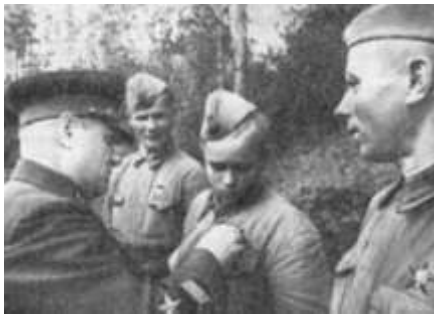
К.А. Мерецков награждает солдата

В ночь на 14 января по льду Ильменя, соблюдая полную тишину, шли батальоны. Люди были одеты в белые маскировочные халаты. Способствовала наступающим и разыгравшаяся метель. Наши передовые подразделения форсировали Ильмень. Внезапность была полная. Гитлеровцы застигнуты спящими.