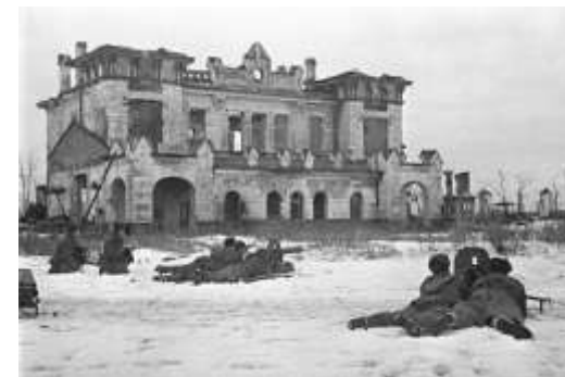
Бои в городе Пушкине

Особое внимание уделял К.А. Мерецков организации и поддержанию взаимодействия. Он справедливо считал, что только согласованными усилиями всех видов Вооружённых Сил и родов войск можно достигнуть победы в короткие сроки и с наименьшими потерями. Примером могут служить операции по прорыву блокады Ленинграда, проведённые совместно Ленинградским и Волховским фронтами. Хорошо понимая важность тесного взаимодействия двух фронтов,