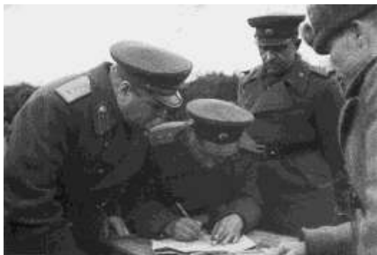
Планирование Петсамо-Киркенесской операции

Умело опираясь на своих заместителей и штаб, Мерецков главное внимание сосредоточивал на решении практических вопросов по подготовке операций, организации взаимодействия, управления и всех видов обеспечения. При этом командующий успевал побывать во всех соединениях, чтобы самому убедиться в правильном понимании поставленных задач и способов их выполнения, поднять боевой настрой личного состава. Его можно было увидеть и на переднем крае, и на командно-наблюдательных пунктах, и возле солдатской кухни. Своей энергией он заражал подчинённых и строго требовал, чтобы все подготовительные мероприятия были выполнены полностью и в установленные сроки.