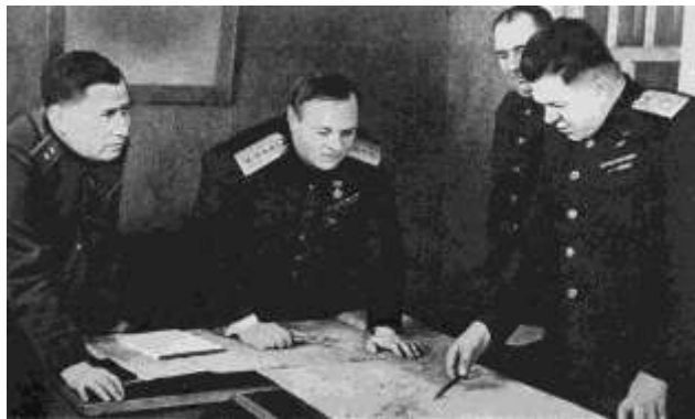
К.А. Мерецков в штабе

всем необходимым. Пугали Гитлера и ненадёжный балканский тыл, а также необходимость преодолевать в ходе наступления многочисленные реки, протекавшие в этом районе с северо-запада на юго-восток. Приведённые мотивы заставили немецко-фашистское руководство придерживаться северного варианта при нападении на СССР, который по всем предъявляемым требованиям имел существенный перевес по отношению к южному.