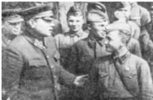
К.А. Мерецков на фронте

Без устали напоминал Кирилл Афанасьевич подчинённым особенности театра военных действий, требовал учитывать, что леса, бездорожье, ограниченная видимость, глубокие снега, холода, заболоченность требуют от солдат сноровки, повышенной выносливости, умения действовать небольшими отрядами и в одиночку, быстро приспосабливаться к изменчивой погоде. Так поступил он и в этот раз. Разведчики, операторы, все сотрудники штаба фронта во главе с его