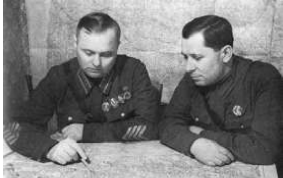
К.А. Мерецков во время войны с финнами

[Для боевой подготовки в ближнем тылу соорудили участки «линии Маннергейма» и научили войска их штурмовать. Разведчики доставили образцы бетона с целью выяснить марку цемента, применявшегося финнами для постройки дотов и других сооружений «линии Маннергейма». Так был определён калибр снарядов и вес взрывчатки, требовавшихся для их разрушения.