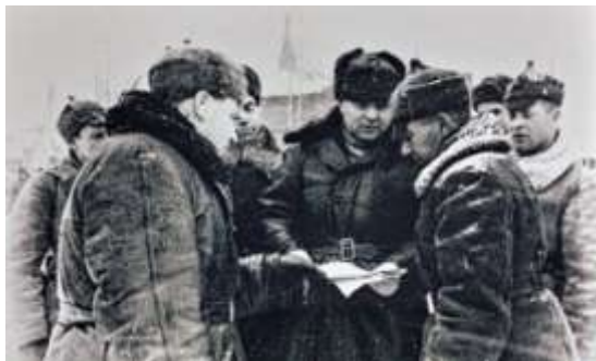
К.А. Мерецков на фронте

В целом деятельность Мерецкова на посту командующим Волховским фронтом в феврале – марте 1942 года оценивается неоднозначно. По мнению одних, при Мерецкове 2-я ударная армия вклинилась в глубину немецкой обороны, но имела коридор и надёжно по нему снабжалась. По мнению других, Мерецков не сумел силами подчинённого ему Волховского фронта расширить горловину прорыва, образовавшегося в результате успешного наступления 2-й ударной армии, то есть не предпринял необходимых мер для предотвращения её окружения. Кроме того, уже в марте объём снабжения войск был совершенно недостаточным даже для закрепления на достигнутых рубежах, не говоря уже о продолжении наступления.